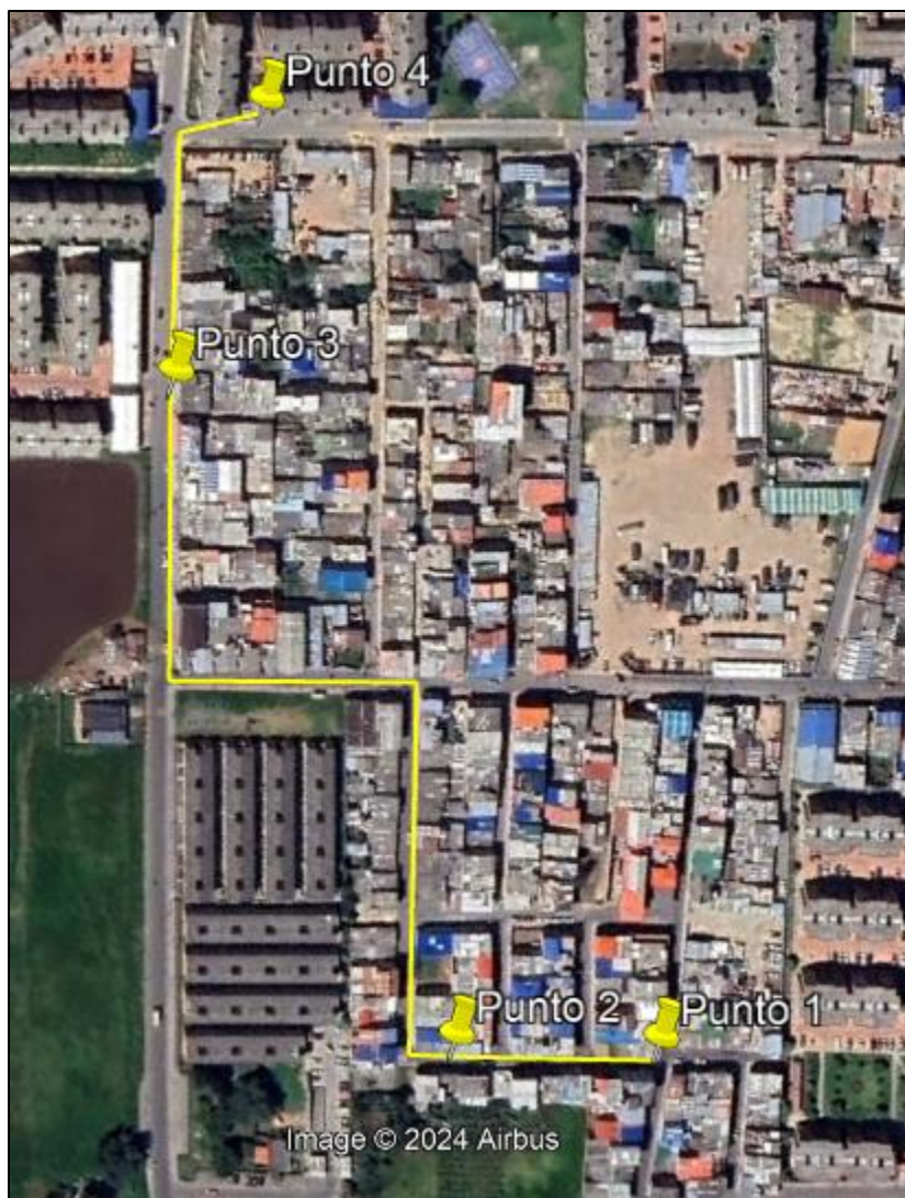
Ilustración 1. Recorrido verificación ambiental

Con base en lo anterior, el día 10 de noviembre de 2024 se realizó recorrido de control y vigilancia en el barrio Porvenir desde las coordenadas 4°42'22,063"N- 74°12'34,001"W hasta las coordenadas 4°42'11,122"N- 74°12'40,859"W (ver ilustración 1. Ruta amarilla).